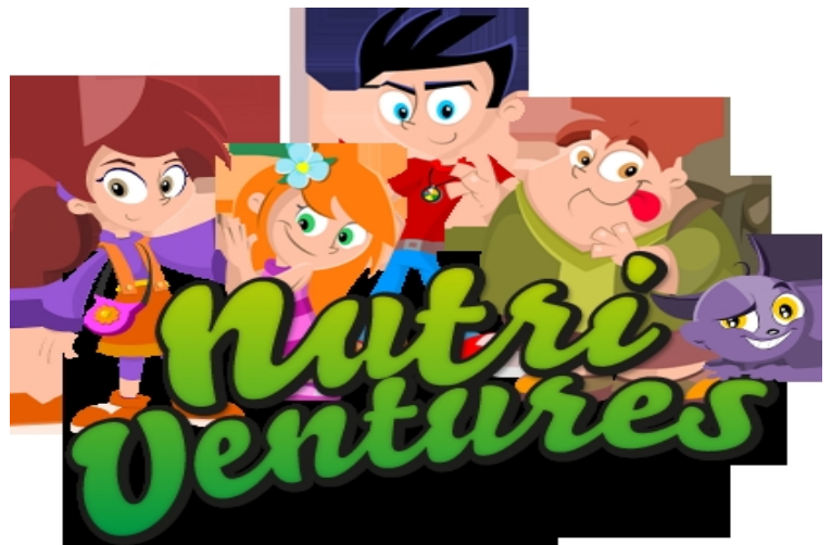
A série tem quatro heróis